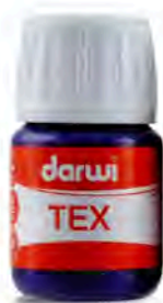
30 ml • DA 010 0030 ***

*** = Numéro de teinte - Colour number - Farbnummer